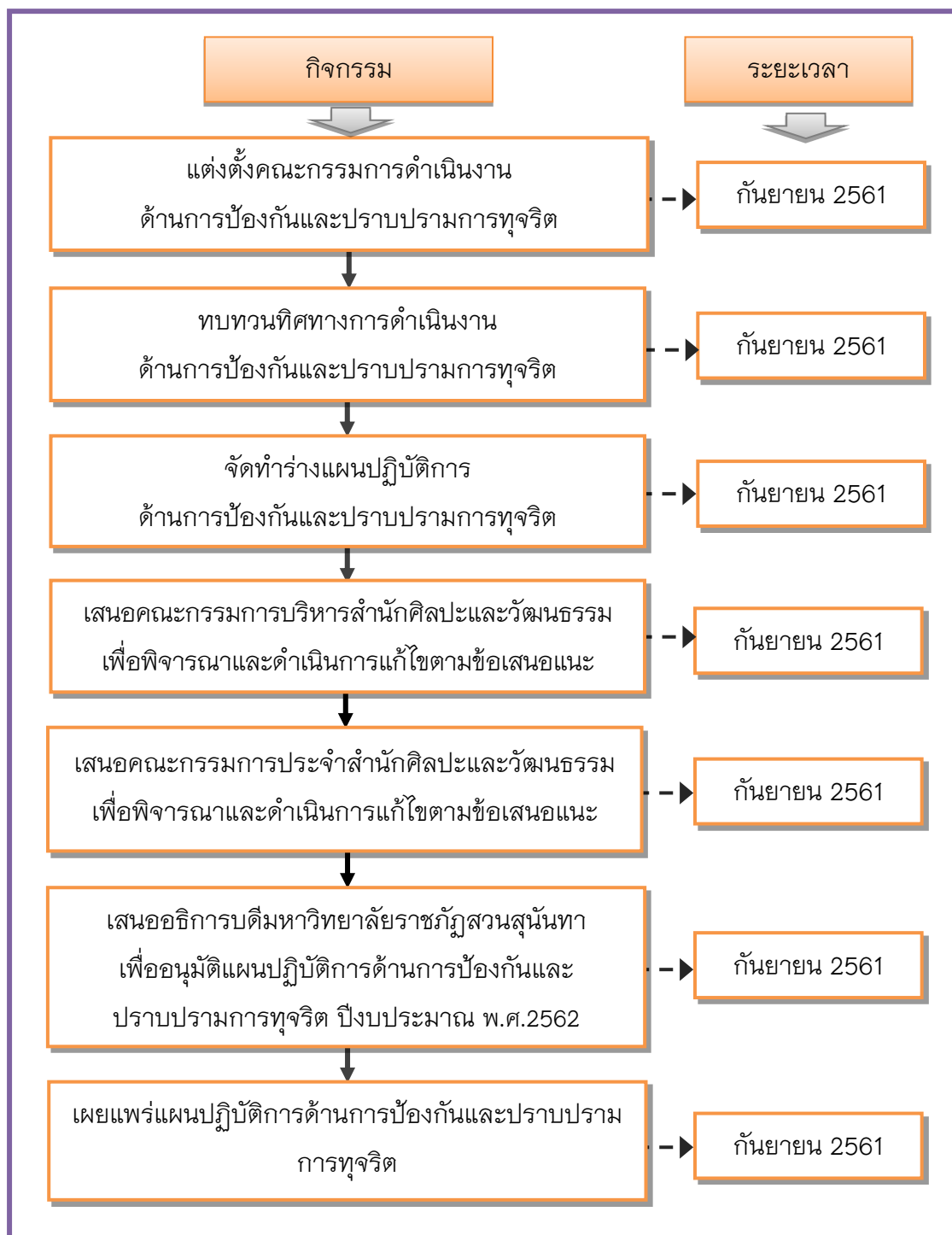
ภาพ : ขั้นตอนการจัดทำแผนปฏิบัติการด้านการป้องกันและปราบปรามการทุจริต